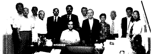
7/19 国会見学・中区の山手地区商店街連合会の皆さん