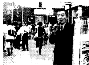
▲ 7/8 金沢文庫駅東口での早朝演説会にて