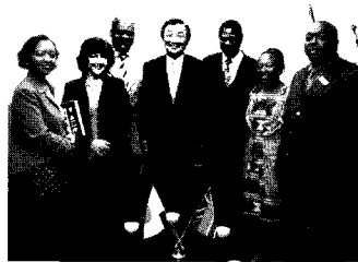
▲ 7/6 ワールドカップの開催国ドイツの次に決定しているのが南アフリカ共和国。そのハウテン州知事一行が表敬訪問にいらっしゃいました