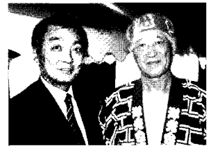
▲ 7/16 磯子区で一番早い盆踊り 洋光台6丁目南自治会盆踊りにて