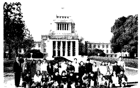
地域の皆さんと共に

政府と全国の自治体は今、経済危機と新型インフルエンザとの戦いを続けています。国民の皆さんの生命と生活を守ること、つまり「危機管理」は政治の最も重要な使命の一つです。私もその最前線に立ちながら、毎日、身の引き締まる思いで仕事を続けています。