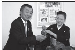
1/9 新條流師範会ます杯交換会・新年会 私が顧問をさせて頂いている新條流の師範をされている方々の新年会で