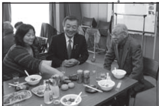
1/8 東町町内会七草粥の会 七草粥を皆さんと楽しくいただき、今年一年のご健勝を祈りました