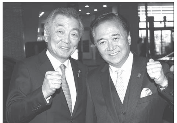
見事三選を果たした黒岩知事を祝う松本衆議(平成31年4月7日)

当選 黒岩 祐治(無所属) 2,251,289 岸 牧子(無所属) 700,091