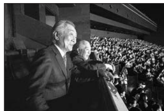
3/17 加藤純一 presents 「第二回配信者ハイパーゲーム大会」●Kアリーナで開催された配信大会。視察に訪れた松本純はその熱気に圧倒されました。eスポーツは教育や介護の現場でも注目が集まっています。