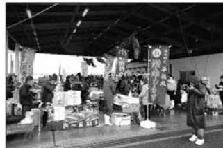
2/25 第8回金沢漁港海産物フェスタ●4年ぶりの開催に大勢の人が訪れ、人気のあさりご飯をはじめ様々な魚食、飲食物等が販売されている港内で、松本純は旧知の方々と言葉を交わしその盛況ぶりを見学しました。